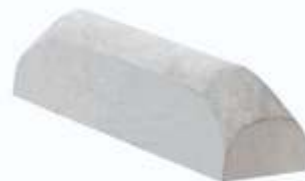
Meio Fio Estacionamento 80x19x20 cm