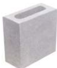
Meio Bloco 9x19x19 cm