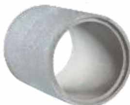
Tubo 0,60x1,00 m