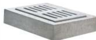
Suporte com Grelha