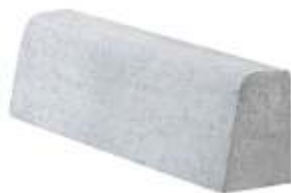
Gelo Baiano 80x23x17 cm