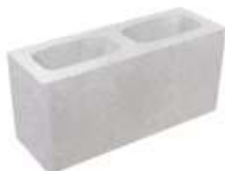
Bloco 14x19x39 cm Vedação Bloco 14x19x39 cm Estrutural