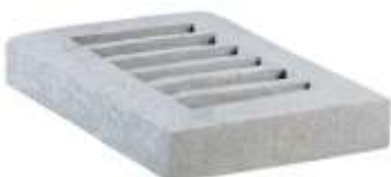
Grelha 70x45x10 cm