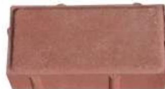
Paver Vermelho 10x20x4 cm Paver Vermelho 10x20x6 cm Paver Vermelho 10x20x8 cm