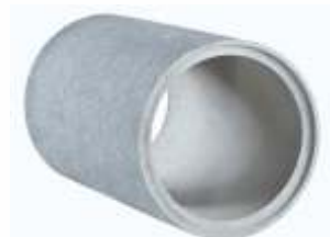
Tubo 0,40x1,00 m