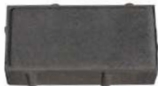
Paver Grafite 10x20x4 cm Paver Grafite 10x20x6 cm Paver Grafite 10x20x8 cm