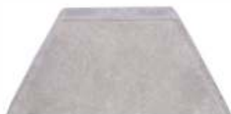
Meio Bloco Sextavado 30x15x8 cm