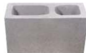
Bloco 14x19x34 cm