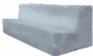
Meio Fio Alto 80x30x25 cm