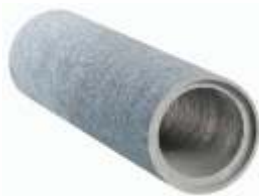
Tubo 0,20x1,00 m