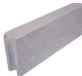
Fincadinha 52x19x8 cm