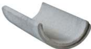
Calha 0,30x1,00 m