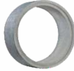
Tubo 2,20x1,00 m