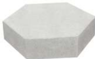
Bloco Sextavado 30x30x8 cm