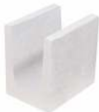
Meia Canaleta 14x19x19 cm