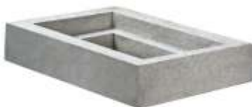
Colarinho Concreto 100x70x20 cm