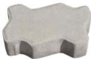
Uni Stein 10x20x8 cm