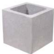
Meio Bloco 19x19x19 cm