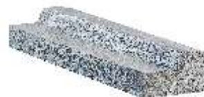
Mini Meio Fio Rebaixado 80x20x12 cm