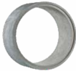
Tubo 2,00x1,00 m