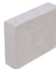
Pastilha 14x19x4 cm