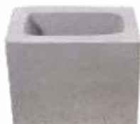
Bloco 14x19x24 cm