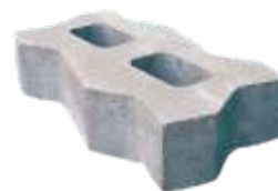
Piso Concregrama 34x17x8 cm