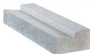
Meio Fio Rebaixado 80x25x15 cm