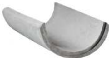
Calha 0,40x1,00 m