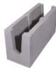
Canaleta 14x19x39 cm