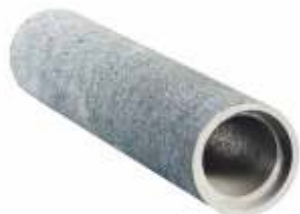
Tubo 0,15x1,00 m