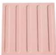
Piso Tátil Direcional 40x40x5 cm