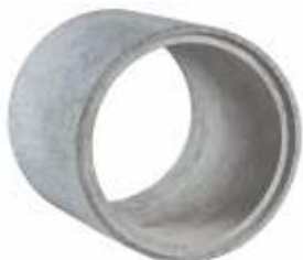
Tubo 0,80x1,00 m