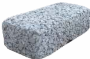
Paver Natural Drenante