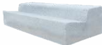
Meio Fio Rebaixado 80x30x15 cm