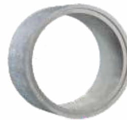
Tubo 1,50x1,00 m