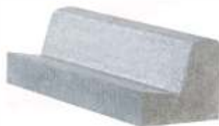
Meio Fio Alto 80x25x25 cm