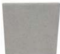
Placa 45x45x5 cm