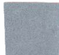
Placa Drenante 45x45x5 cm