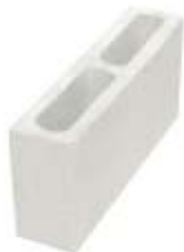
Bloco 9x19x39 cm Vedação