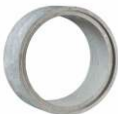
Tubo 1,00x0,50 m