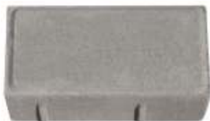
Paver Natural 10x20x4 cm Paver Natural 10x20x6 cm Paver Natural 10x20x8 cm