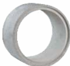
Tubo 0,80x0,50 m