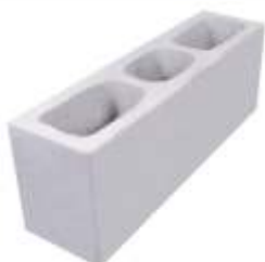
Bloco 14x19x54 cm