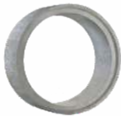
Tubo 1,80x1,00 m