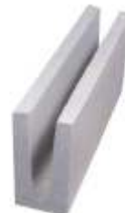
Canaleta 9x19x39 cm