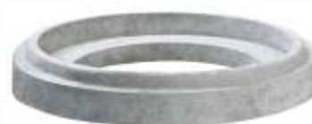
Laje Redução 80x60 cm