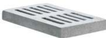
Grelha 80x50x10 cm