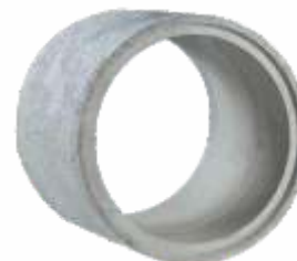
Tubo 1,00x1,00 m