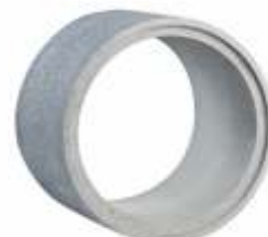
Tubo 0,60x0,50 m