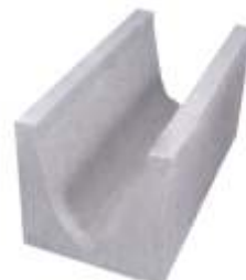
Canaleta 19x19x39 cm