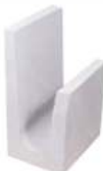
Canaleta J 14x19x19 cm