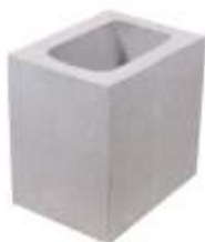
Meio Bloco 14x19x19 cm