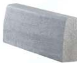
Meio Fio Reto 80x10x30 cm