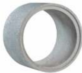
Tubo 1,20x1,00 m