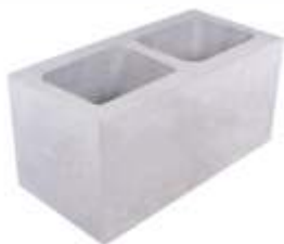
Bloco 19x19x39 cm Estrutural