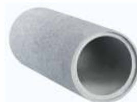
Tubo 0,30x1,00 m