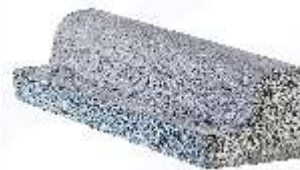
Mini Meio Fio Alto 80x20x17 cm