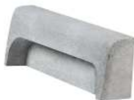
Meio Fio Boca de Lobo 80x25x25 cm